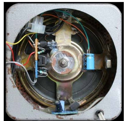
Speaker en timer (in buik)